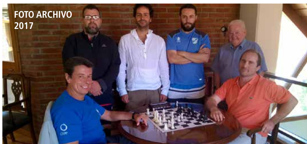
FOTO ARCHIVO 2017

SE COMPITE DOMINGO 16, LUNES 17 y MARTES 18 A partir de 10:00 hs.: Reunión de competidores y comienzo de la competencia